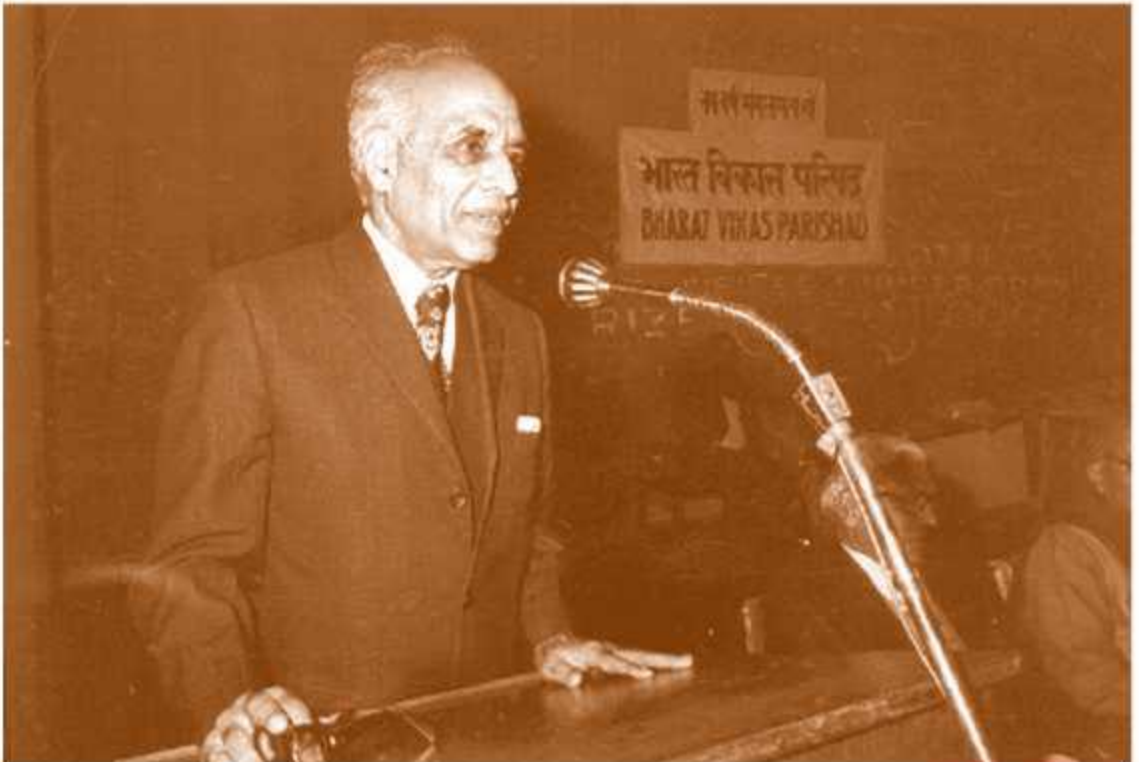
न्या. एच. आर. खन्ना