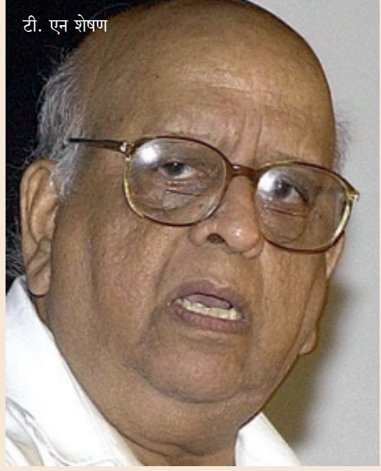
टी. एन शेषण

पाठीराखा असून, 'नियम वाकवून धर्माचा आधार घेत निवडणूक वेळापत्रक आखून, भाजपचा हरतऱ्हेने कसा फायदा होईल, याची तजवीजच आयोगाने केली' असेही प्रशांत किशोर म्हणाले. ( https://indianexpress.com/article/explained/west-bengal-elections-2021-tmc-bjp-congress-cpm-election-commission-7207375/ )